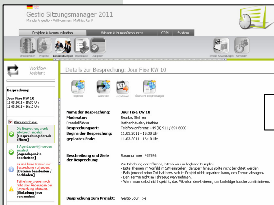
1. Moderator und Vortragende planen vernetzt die Besprechung